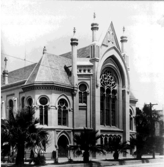
Fachada del Templo B'nai Israel en Galveston, la cual Henry Cohen fue invitado para dirigir en 1888.

Los judíos han sido blanco de opresión de Europa Occidental y Rusia. En Texas encontraron libertad para practicar su religión, seguir su estilo de vida y buscar oportunidades para avanzar económicamente.