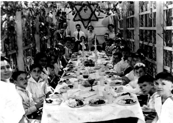
Una comida sucot en una sucá en una escuela dominical en Laredo, c. 1935 –Sucot es un festival de la cosecha de otoño y se celebra en memoria de sus antepasados que vivieron en tierras salvajes después de huir de Egipto. Las familias judías construían sucas (cabañas temporales) con techos de ramas verdes. Por lo menos una vez al día, por ocho días, familias y amigos compartían comidas en las sucas.

Conocidos por su lucha de justicia social, los judíos tejanos se involucraron en los cambios de la vida moderna mientras mantenían algunas de las costumbres culturales más antiguas del mundo.