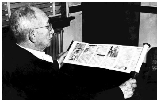
Rabino Henry Cohen (aquí a los 79 años de edad) adquirió una reputación nacional por sus empeños filantrópicos y humanitarios durante sus 62 años en Texas.

El judaísmo es una religión y también un estilo de vida suficientemente dominante para crear una identidad tan poderosa como cualquier otro grupo nacional, cultural o étnico en el estado. Al principio el judaísmo estaba conectado a un área geográfica en particular—y después por siglos a una falta de patria natal—lo que ayudó a establecer y a mantener un grupo cultural alrededor del mundo.