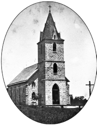
Iglesia de la Inmaculada Concepción de la Sagrada Virgen María, Panna Maria

Los tejanos polacos han sido por muchos años uno de los grupos étnicos más aislados, preservadores de tradiciones, conservadores, y rurales del estado.